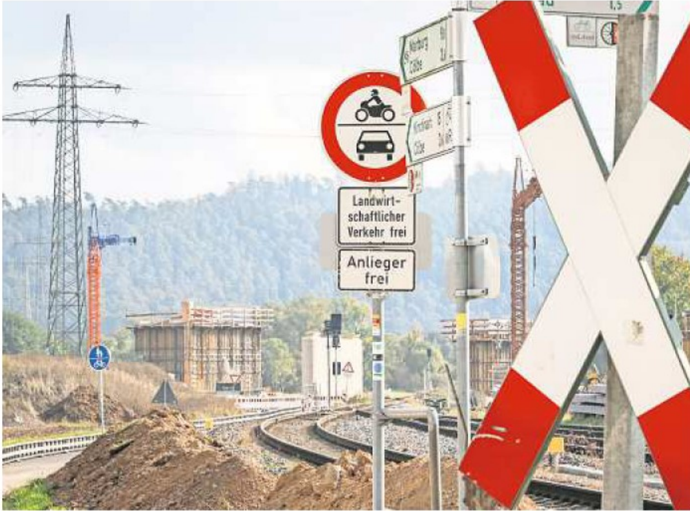
Blick auf die Baustelle an der Bundesstraße 252 bei Sarnau.